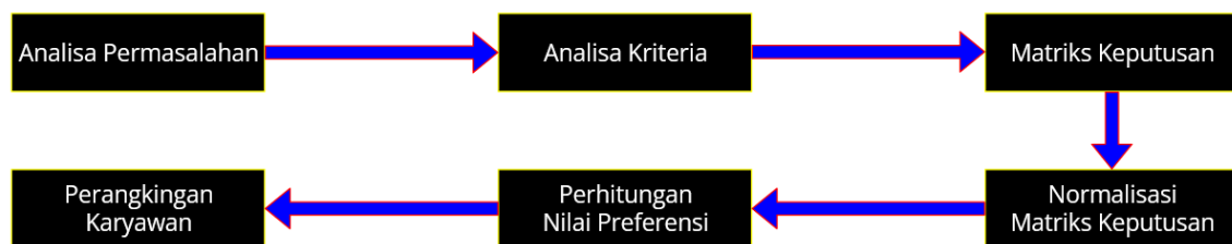
Gambar 1. Urutan Langkah Penelitian

Metode penelitian merupakan proses urutan pengerjaan yang dilakukan untuk mengumpulkan informasi dan data serta melakukan analisa dan pemrosesan terhadap data sehingga mendapatkan sebuah hasil analisa dari penelitian yang dilakukan [15], [16]. Untuk memulai penelitian diperlukan tahapan penelitian yang tersusun secara terstruktur untuk menyelesaikan permasalahan penelitian yang berisi tentang prosedur dalam melaksanakan penelitian [17]. Langkah-langkah yang dilakukan dalam penelitian ini disajikan pada Gambar 1.