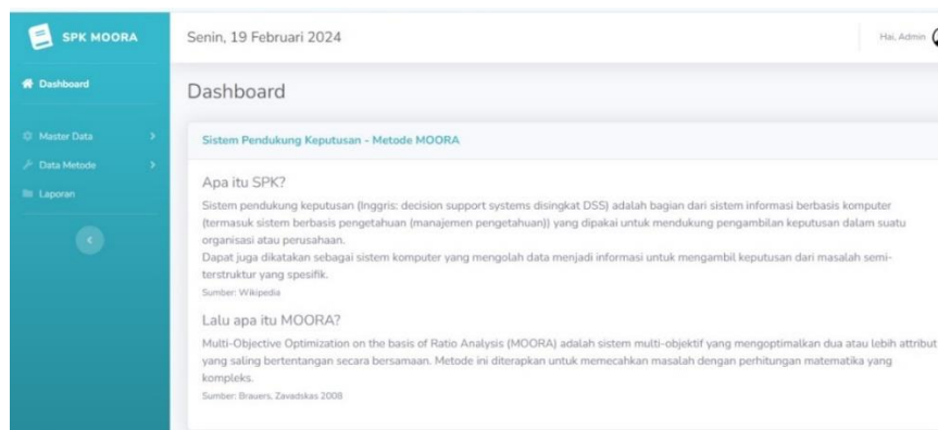
Gambar 3. Halaman Dashboard

Halaman utama pada aplikasi bantuan siswa miskin (BSM) sebagai media informasi untuk sekolah mengenai petunjuk menggunakan aplikasi bantuan siswa miskin (BSM)