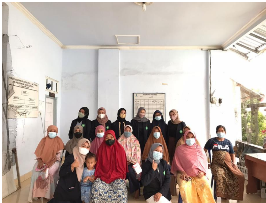
Gambar 2. Kegiatan Penyuluhan