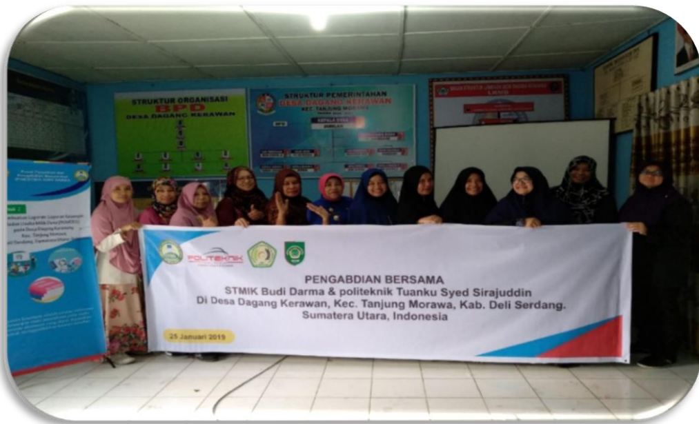
Gambar 5. Photo Bersama oleh peserta pelatihan dengan pemateri

Sesudah selesai kegiatan english camp yang dilaksanakan oleh pihak kampus Universitas Budi Darma, selanjutnya melakukan Foto bersama pihak kampus Universitas Budi Darma dengan masyarakat peserta pelatihan pengabdian masyarakat seperti gambar 5 dibawah ini: