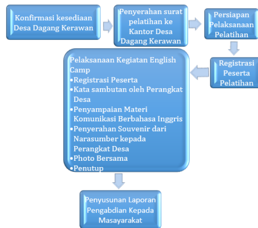
Gambar 1. Kerangka Metode Pelaksanaan Kegiatan

Pada gambar 1 dibawah ini ialah gambaran kerangka dari penejelasan diatas dari kegiatan pengabdian masyarakat sebagai berikut: