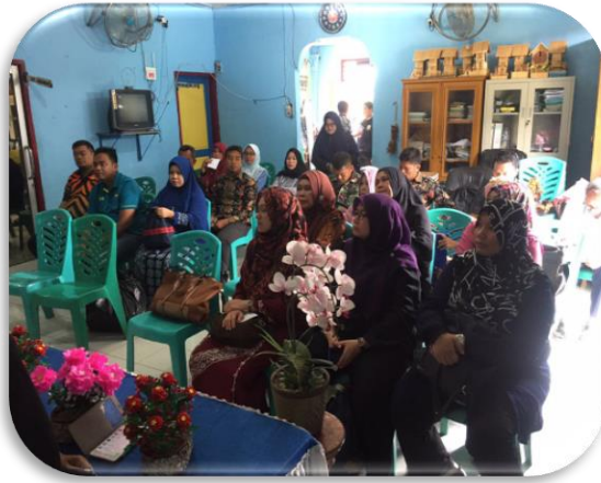
Gambar 4. Photo Sesi tanya jawab oleh peserta pelatihan dengan pemateri