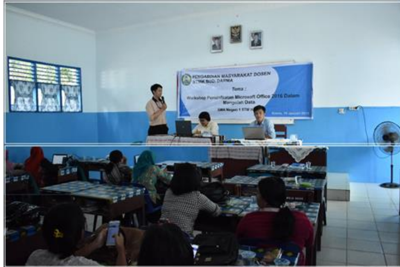
Gambar 4. Memberikan Materi

Pada kegiatan pengabdian ini, Dosen Universitas Budi Darma medan memberikan materi mengenai pengolahan data di Microsoft Office agar guru SMA Negeri 1 STM Hilir dapat lebih memahami tentang pengolahan data di Microsoft Office tersebut. Berkut ini dapat dilihat pada gambar di bawah ini saat dosen menjelaskan atau memberikan sebuah materi penjelasan.