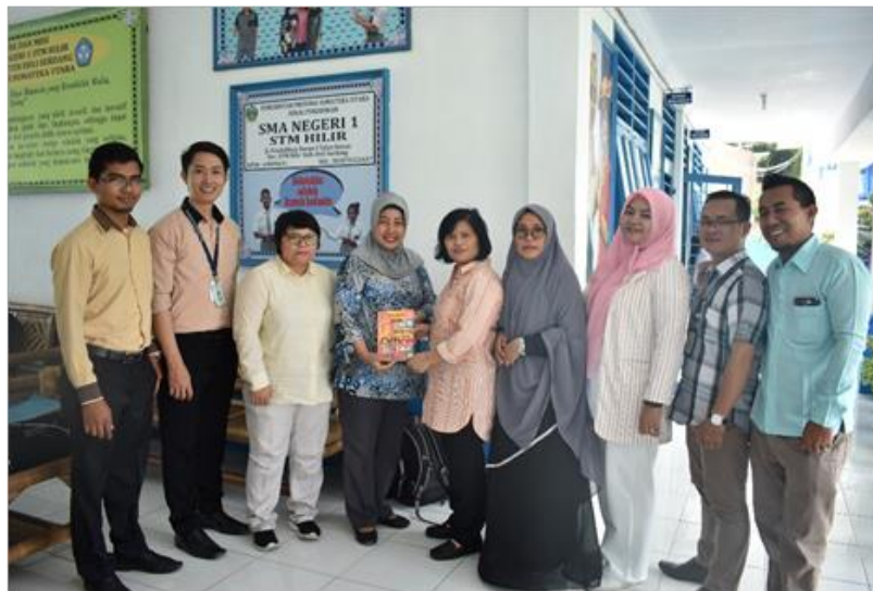
Gambar 5. Foto Bersama

Selesai pengabdian dilakukan oleh dosen Universitas Budi Darma Medan, maka dilakukan pemerberian cinderamata. Dapat dilihat pada gambar dibawah ini: