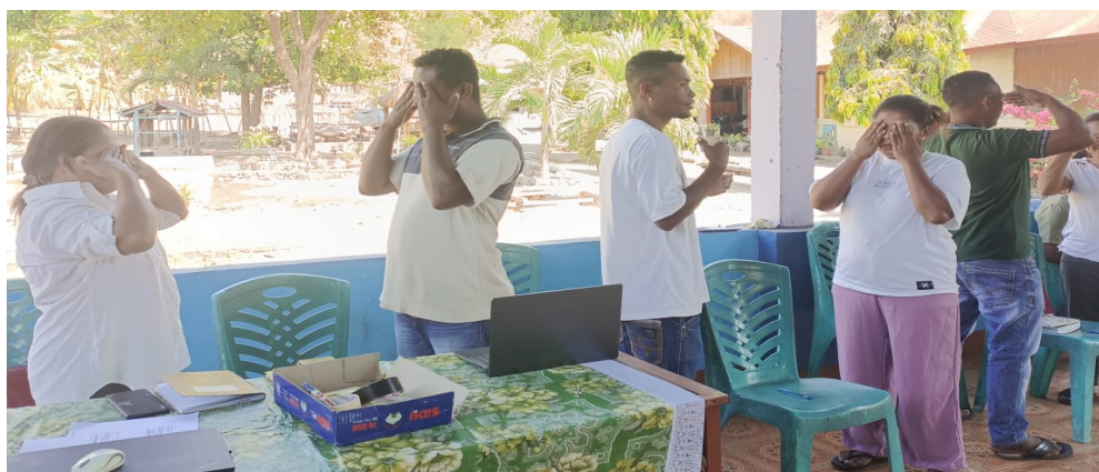
Gambar 2. Kegiatan pendampingan ibu hamil

Praktik konkret seperti pendataan ibu hamil, kunjungan pastoral, doa, dan distribusi makanan bergizi menjadi indikator komitmen komunitas terhadap pelayanan berbasis kasih. Di tingkat paroki, beberapa pastor telah mengambil inisiatif melalui penyediaan kotak amal khusus, bantuan perlengkapan bayi, dan pemberkatan ibu hamil, walaupun pelaksanaannya belum sepenuhnya konsisten di seluruh stasi. Temuan ini mengindikasikan adanya kesadaran kolektif yang mulai tumbuh dan bergerak menuju model pelayanan pastoral yang lebih inklusif, kontekstual, dan responsif terhadap kebutuhan psiko-spiritual ibu hamil.