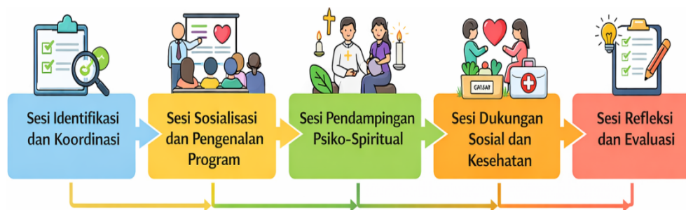
Gambar 1. Tahapan Pelaksanaan Kegiatan Pengabdian Gerakan KUB Peduli Ibu Hamil

Kegiatan pengabdian dilaksanakan melalui tahapan identifikasi permasalahan ibu hamil di lingkungan KUB, koordinasi dengan paroki dan ketua KUB, perencanaan kegiatan pendampingan, pelaksanaan pendampingan psiko-spiritual, refleksi bersama, serta evaluasi kegiatan sebagai dasar perumusan rekomendasi pastoral.