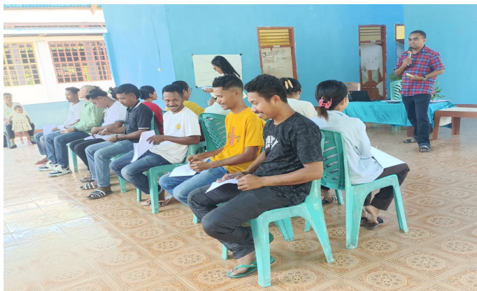
Gambar 4. Aktivitas permainan edukatif (games) sebagai media penguatan psiko-spiritual ibu hamil dalam pendampingan KUB

Dalam pelaksanaan pendampingan, penguatan psiko-spiritual juga dilakukan melalui aktivitas partisipatif berupa permainan edukatif (games) yang dirancang untuk menciptakan suasana aman, rileks, dan reflektif bagi ibu hamil. Salah satu peserta menyampaikan, “Waktu ikut permainan, saya bisa tertawa dan lupa sebentar dengan rasa cemas. Hati jadi lebih ringan” (IH-12). Aktivitas ini berfungsi sebagai medium untuk membangun emosional, menurunkan ketegangan, dan membuka ruang refleksi diri secara spiritual.