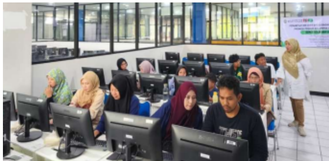
Gambar 3. Pelaksanaan Kegiatan

kampanye digital yang menarik. Antusiasme peserta terlihat dari partisipasi aktif dalam praktik langsung dan diskusi yang berlangsung selama kegiatan. Adapun pelaksanaan kegiatan terdapat seperti pada Gambar 3.