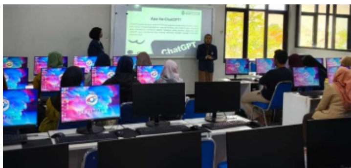
Gambar 4. Pelaksanaan Kegiatan di dampingi mahasiswa

Kegiatan ini dipandu oleh seluruh anggota tim pengabdian dan didampingi oleh beberapa mahasiswa sebagai fasilitator teknis. Pelatihan dibuka dengan pengenalan konsep dasar: Literasi Digital & Pemasaran UMKM, pengenalan Artificial Intelligence (AI) untuk UMKM, Mengenal ChatGPT sebagai Alat Promosi, Dasar-dasar Prompting untuk UMKM dan Strategi Promosi Digital Sederhana untuk UMKM. Dasar-dasar Prompting untuk UMKM juga diberikan dalam permulaan agar UMKM mampu “berbicara” dengan AI secara efektif. Peserta diajak untuk mencoba langsung menuliskan prompt sesuai karakteristik produk masing-masing, lalu mengevaluasi hasilnya bersama fasilitator. Mahasiswa berperan aktif mendampingi peserta dalam praktik digital, mulai dari login akun hingga mengarahkan penggunaan fitur ChatGPT secara optimal. Adapun pelaksanaan kegiatan pelatihan pada Gambar 4.