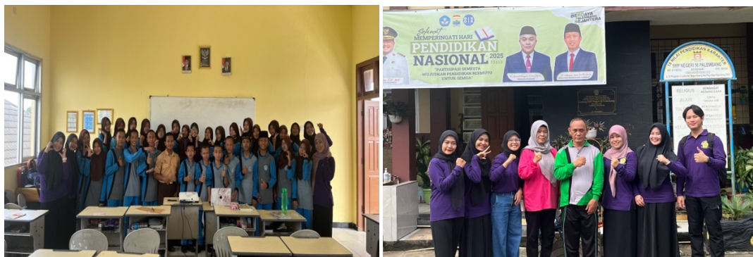
Gambar 4. Dokumentasi Tim pengabdian, peserta dan pihak sekolah