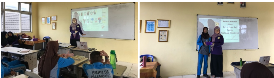
Gambar 3. Kegiatan edukasi dan pemberian reward pada sesi tanya jawab

Untuk meningkatkan pemahaman dan keterlibatan siswa, edukasi didukung dengan media visual, contoh langsung wadah pangan yang memiliki kode dan logo, serta diskusi berbasis pengalaman siswa sehari-hari (Gambar 3). Metode ini bertujuan agar siswa tidak hanya menerima informasi secara pasif, tetapi juga mampu mengaitkan materi dengan praktik konsumsi yang mereka lakukan. Setelah penyampaian materi, kegiatan dilanjutkan dengan sesi tanya jawab yang berlangsung selama kurang lebih 15 menit. Sesi ini dilaksanakan secara interaktif melalui pemberian pertanyaan kepada peserta serta kesempatan bagi peserta untuk mengajukan pertanyaan terkait materi yang belum dipahami. Untuk meningkatkan partisipasi dan keaktifan siswa, sesi tanya jawab dilakukan dengan pemberian reward atau kado edukatif kepada peserta yang mampu menjawab pertanyaan dengan tepat atau mengajukan pertanyaan yang relevan (Gambar 3). Kegiatan ini bertujuan sebagai sarana penguatan pemahaman materi sekaligus sebagai tolok ukur tingkat pemahaman siswa terhadap materi yang telah disampaikan.