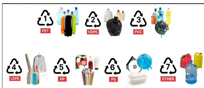
Gambar 6. Kode resin dan simbol ada wadah plastik

Plastik dengan kode PET atau PETE merupakan jenis plastik yang paling umum dijumpai, terutama untuk botol air minum, minuman bersoda, dan kemasan sekali pakai lainnya. PETE memiliki sifat bening, ringan, dan mampu menghambat masuknya gas, sehingga sesuai untuk kemasan minuman. Namun, berbagai kajian menunjukkan bahwa PETE hanya aman untuk sekali pakai. Penggunaan berulang, terutama untuk menyimpan air hangat atau panas, dapat meningkatkan risiko migrasi senyawa kimia seperti DEHA ke dalam minuman, yang berpotensi berdampak buruk pada organ tubuh, termasuk hati, serta meningkatkan risiko karsinogenik dalam jangka panjang.