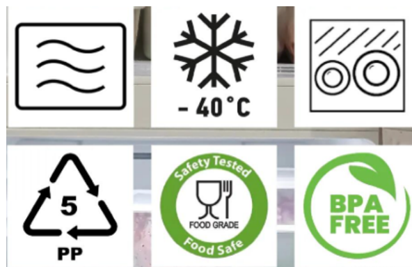
Gambar 7. Simbol umum pada wadah pangan

Gambar 7 menunjukkan sejumlah simbol pada kemasan plastik yang memiliki makna berbeda terkait aspek keamanan pangan. Simbol microwave-safe, yang berupa garis bergelombang, menunjukkan bahwa wadah dapat digunakan untuk pemanasan di microwave tanpa mudah rusak. Namun, pengguna tetap perlu memastikan apakah seluruh bagian wadah, termasuk tutup, memiliki ketahanan panas yang sama. Simbol freezer-safe menandakan bahwa wadah dapat digunakan untuk penyimpanan pada suhu beku tanpa mudah retak, Meskipun demikian, tetap disarankan memberi ruang pada isi makanan untuk mengantisipasi pemuaian saat pembekuan. Simbol food contact berupa gambar gelas dan garpu menandakan bahwa bahan wadah telah memenuhi standar keamanan untuk kontak langsung dengan makanan dan minuman.