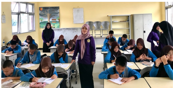
Gambar 2. Kegiatan Pre-test kemaman wadah pangan

sebelum pemberian materi edukasi dan dikerjakan secara mandiri oleh siswa dengan pendampingan tim pengabdian. Hasil pre-test digunakan untuk mengetahui gambaran awal pemahaman siswa serta sebagai dasar evaluasi efektivitas intervensi edukasi.