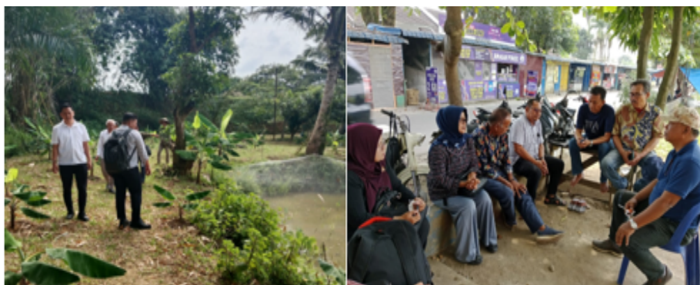
Gambar 2. Survei dan Identifikasi Kebutuhan Mitra

Tahap awal kegiatan diawali dengan analisis situasi untuk mengidentifikasi permasalahan yang dihadapi mitra dalam kegiatan budidaya ikan. Analisis dilakukan melalui observasi lapangan, diskusi, dan wawancara langsung dengan mitra serta perangkat desa (Kristina, 2024; Romdona et al., 2025). Hasil analisis menunjukkan bahwa pemberian pakan ikan masih dilakukan secara manual, menyebabkan ketidakteraturan jadwal dan dosis pakan, pemborosan pakan, serta peningkatan biaya operasional. Berdasarkan permasalahan tersebut, disepakati bahwa penerapan mesin pemberi pakan ikan otomatis merupakan solusi awal yang paling sesuai dan realistis untuk meningkatkan efisiensi budidaya ikan (Aldo et al., 2024; Hanafi et al., 2025). Dokumentasi saat pelaksanaan survei lapangan dapat dilihat pada Gambar 2.