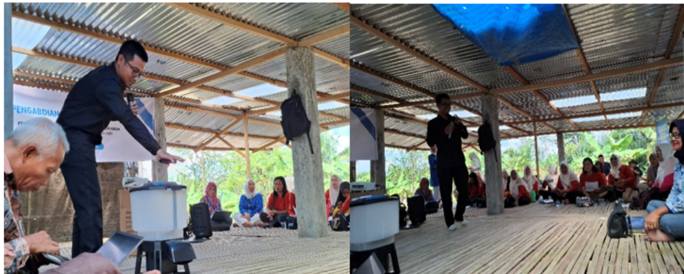
Gambar 4. Pelatihan dan Pendampingan Penggunaan Mesin Pemberi Pakan Ikan Otomatis

arah berbasis IoT, seperti pemantauan jarak jauh dan integrasi sensor. Dokumentasi pelatihan dan pendampingan ditampilkan pada Gambar 4.