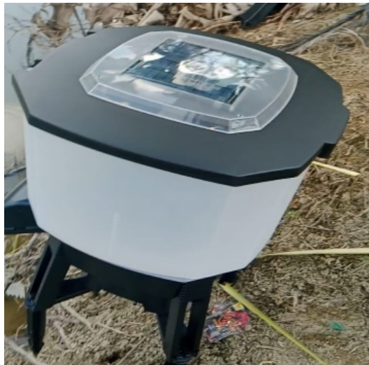
Gambar 3. Penerapan Mesin Pemberi Pakan Ikan Pada Kolam Ikan

Tahap selanjutnya adalah implementasi mesin pemberi pakan ikan otomatis merk Sunsu CF-212 pada kolam budidaya mitra. Mesin yang digunakan mampu mengatur waktu dan dosis pemberian pakan secara terjadwal tanpa intervensi manual (Ulhaq, 2024). Pada tahap ini, dilakukan penyesuaian pengaturan mesin sesuai dengan kebutuhan mitra, seperti jadwal pemberian pakan pagi dan sore serta takaran pakan yang disesuaikan dengan kondisi kolam dan jenis ikan. Implementasi teknologi ini difokuskan sebagai tahap awal (pra-IoT) yang berfungsi sebagai fondasi menuju pengembangan sistem berbasis Internet of Things (IoT) pada tahap lanjutan. Berikut dokumentasi penerapan mesin pada kolam ikan secara langsung seperti ditampilkan pada Gambar 3.