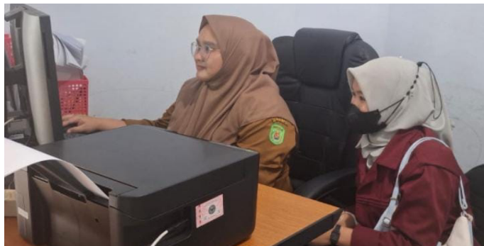
Gambar 2. Kegiatan pelatihan dan pendampingan aparatur Desa Suka Damai dalam optimalisasi pemanfaatan absensi digital.