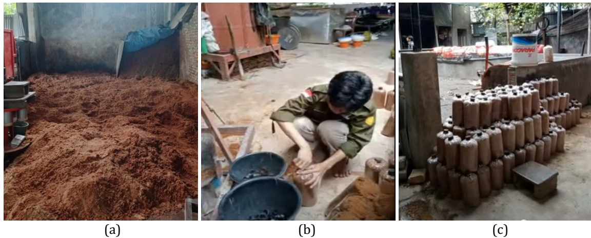
Gambar 3. Pembuatan baglog media tanam jamur tiram: (a) Media tanam jamur tiram yang terdiri atas serbuk gergaji, dedak padi, dan kapur; (a) Pengisian media tanam ke dalam plastik baglog; (c) Baglog siap tanam.