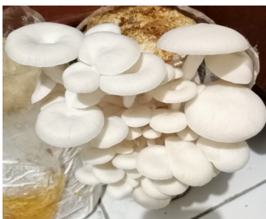
Gambar 5. Jamur Tiram Siap Panen

Tahap kelima adalah proses panen dan penanganan pascapanen jamur tiram. Pada tahap ini mahasiswa dilatih mengenali tanda-tanda jamur tiram siap panen, yaitu tudung jamur telah mekar sempurna namun belum pecah. Proses panen dilakukan secara hati-hati dengan memetik rumpun jamur sekaligus agar tidak merusak baglog dan memungkinkan tumbuhnya flush berikutnya. Hulyadi et al. (2022) menyebutkan terdapat tiga faktor penting untuk panen maksimal yaitu media tanam yang kaya nutrisi, pengendalian iklim yang ideal, dan pencegahan kontaminasi.