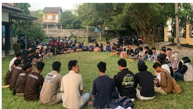
Gambar 4. Diskusi tentang keberlanjutan program GESTING

Pada Gambar 3. Menunjukkan pelaksanaan sosialisasi dan foto bersama setelah kegiatan berlangsung, sosialisasi diikuti sebanyak 23 peserta, yang merupakan remaja anggota Karang Taruna Desa Sukaraja, kegiatan tersebut berlangsung dengan lancar, menunjukkan kerjasama yang baik antara tim pengabdian Universitas Bumigora dengan Desa Sukaraja, khususnya Karang Taruna Desa Sukaraja.