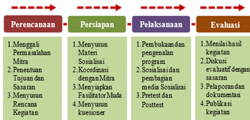
Gambar 1. Tahapan Kegiatan

Pendekatan berbasis komunitas ini sejalan dengan konsep pemberdayaan remaja, di mana peserta tidak hanya menjadi objek edukasi, tetapi juga agen perubahan yang dapat menyebarkan informasi yang benar kepada lingkungan sosialnya. Pelaksanaan program dilakukan melalui beberapa tahapan yang disusun secara berurutan untuk memastikan relevansi, efektivitas, serta kesesuaian dengan kondisi sosial budaya masyarakat Desa Sukaraja. Tahapan ini meliputi tahapan Perencanaan, Persiapan, Pelaksanaan, dan Evaluasi kegiatan, adapun beberapa tahapan tersebut dapat dilihat pada Gambar 1.