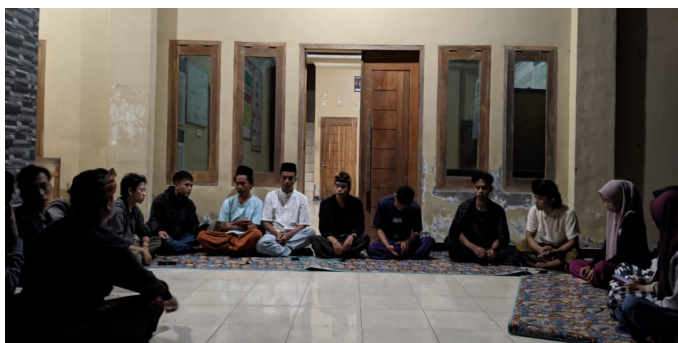
Gambar 2. Diskusi persiapan sebelum kegiatan pengabdian

Dibawah ini ditampilkan beberapa foto pelaksanaan kegiatan sosialisasi yang sudah dilaksanakan, diantaranya foto persiapan kegiatan, pelaksanaan dan foto rembuk kegiatan dalam upaya pelaksanaan tindak lanjut kegiatan bersama remaja. Pada Gambar 2. Menunjukkan tahapan persiapan dan rembuk kegiatan bersama anggota dan pengurus Karang Taruna Desa Sukaraja, Persiapan membahas beberapa hal penting yang dapat menunjang kegiatan sosialisasi bahaya pernikahan usia anak sebagai penyebab stunting