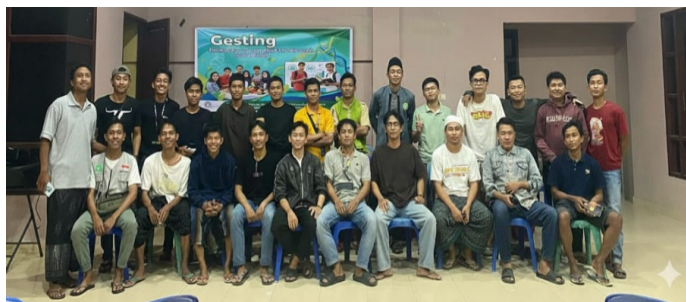
Gambar 3. Foto bersama peserta dan tim pengabdian Gesting Universitas Bumigora

Pada Gambar 3. Menunjukkan pelaksanaan sosialisasi dan foto bersama setelah kegiatan berlangsung, sosialisasi diikuti sebanyak 23 peserta, yang merupakan remaja anggota Karang Taruna Desa Sukaraja, kegiatan tersebut berlangsung dengan lancar, menunjukkan kerjasama yang baik antara tim pengabdian Universitas Bumigora dengan Desa Sukaraja, khususnya Karang Taruna Desa Sukaraja.