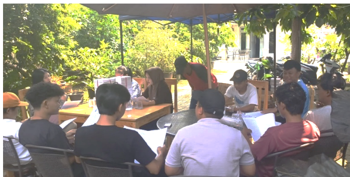
Gambar 3. Tim Abdimas ITB Ahmad Dahlan memberikan literasi tentang wakaf

Dampak langsung: meningkatnya kesadaran karyawan terhadap potensi wakaf dalam memperkuat ketahanan ekonomi perusahaan dan masyarakat sekitar. Tindak lanjut: tim pengabdian bersama manajemen CV. Sarana sepakat untuk menyusun rencana pengelolaan aset sosial berbasis wakaf produktif, dimulai dari pemetaan aset yang dapat dikelola secara berkelanjutan. Dengan hasil peningkatan literasi sebesar 33% dan munculnya inisiatif internal dari peserta, kegiatan ini berhasil mencapai tujuannya, yaitu menumbuhkan kesadaran dan pemahaman praktis tentang wakaf produktif sebagai instrumen pemberdayaan ekonomi umat.