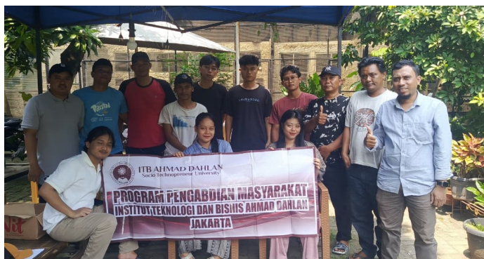
Gambar 4. Kegiatan akhir dengan foto bersama mitra

Dampak langsung pelaksanaan kegiatan pengabdian kepada masyarakat dapat dilihat dari tingginya partisipasi dan keterlibatan aktif mitra selama proses literasi dan pendampingan, sebagaimana terdokumentasi pada gambar 3 yang menunjukkan kolaborasi antara tim pengabdian Institut Teknologi dan Bisnis Ahmad Dahlan Jakarta dengan manajemen dan karyawan CV. Sarana Teknik Industri. Selanjutnya, gambar 4 memperlihatkan suasana diskusi dan pendampingan partisipatif, di mana peserta secara aktif mengikuti pembahasan materi, berdiskusi, serta mengisi instrumen evaluasi, yang mencerminkan terjadinya proses pembelajaran dua arah. Dampak dari kegiatan ini tidak hanya terlihat pada peningkatan pemahaman peserta terhadap wakaf produktif dan manajemen keuangan syariah, tetapi juga pada perubahan sikap dan munculnya inisiatif internal untuk memetakan serta mengelola aset sosial sebagai wakaf produktif. Sebagai tindak lanjut, tim pengabdian dan mitra merencanakan pendampingan lanjutan berupa penguatan tata kelola wakaf internal, penyusunan sistem pencatatan keuangan syariah yang lebih terstruktur, serta penajakan kerja sama dengan lembaga wakaf dan keuangan syariah guna mendukung keberlanjutan implementasi wakaf produktif di lingkungan usaha mitra.