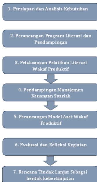
Gambar 1. Bagan metode pelaksanaan

Kegiatan pengabdian kepada masyarakat ini dilaksanakan pada 6 September 2025 dan berlokasi di CV. Sarana Teknik Industri, yang beralamat di Rawa Melati, Tegal Alur, Kalideres, Jakarta Barat. Program ini melibatkan 13 orang karyawan sebagai peserta utama dan dilaksanakan melalui pendekatan partisipatif dan kolaboratif, yang menempatkan mitra sebagai subjek aktif dalam seluruh rangkaian kegiatan. Pendekatan partisipatif dipilih karena dinilai efektif dalam meningkatkan pemahaman, rasa kepemilikan, dan keberlanjutan program pemberdayaan ekonomi berbasis komunitas (Purwaningsih & Susilowati, 2020). Adapun tahapan pelaksanaannya dapat dilihat pada gambar 1. Di bawah ini