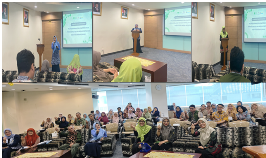
Gambar 2. Dari kiri atas ke bawah

Kegiatan pengabdian kepada masyarakat ini dilaksanakan pada hari Rabu, 13 Agustus 2025 jam 07.00-15.30. Kegiatan pelatihan dilaksanakan di Universitas Yarsi dengan peserta guru-guru yang tergabung dalam Musyawarah Guru Mata Pelajaran (MGMP) Akuntansi Wilayah II Jakarta Pusat yang berjumlah 36 orang. Program ini merupakan bentuk nyata kontribusi akademisi dalam mendukung peningkatan kapasitas guru di bidang akuntansi, sehingga diharapkan mampu memberikan dampak positif terhadap proses pembelajaran di sekolah masing-masing.