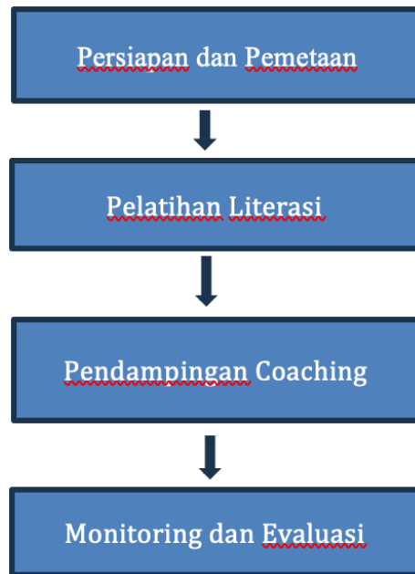
Gambar 1. Metode Pelaksanaan Kegiatan