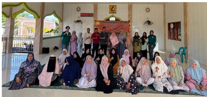
Gambar 7. Foto Bersama Peserta