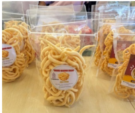
Gambar 2. Produk Telur Gabus Keju

Produk ini merupakan camilan ringan buatan pelaku UMKM lokal yang telah memperoleh pendampingan dalam hal pengemasan dan pelabelan produk. Kemasan transparan dengan label merek “Telur Gabus Keju Ala Yusi” menampilkan identitas produk, kontak produsen, dan logo halal. Pendampingan ini membantu pelaku usaha meningkatkan daya tarik visual produk serta membangun kepercayaan konsumen melalui kemasan yang higienis dan profesional.