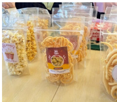
Gambar 3. Produk Kue Pret dan Popcorn Rasa Original

Produk ini merupakan camilan ringan buatan pelaku UMKM lokal yang telah memperoleh pendampingan dalam hal pengemasan dan pelabelan produk. Kemasan transparan dengan label merek “Telur Gabus Keju Ala Yusi” menampilkan identitas produk, kontak produsen, dan logo halal. Pendampingan ini membantu pelaku usaha meningkatkan daya tarik visual produk serta membangun kepercayaan konsumen melalui kemasan yang higienis dan profesional.