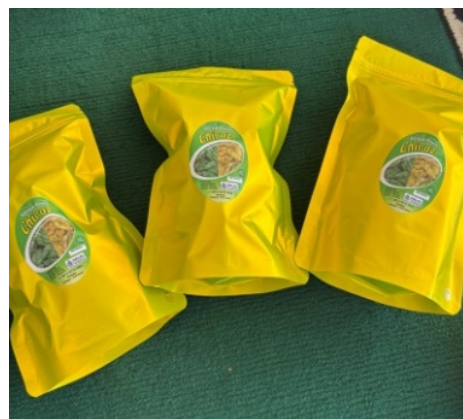
Gambar 4. Produk “Keripik Kepok Chiraz”

Gambar ini menampilkan variasi produk camilan hasil produksi UMKM Desa Lampupok yang telah mengikuti pelatihan desain label dan digital marketing. Melalui pelatihan tersebut, pelaku usaha mampu memanfaatkan desain kemasan yang lebih menarik, serta melakukan promosi produk melalui media sosial dan platform pesan instan. Inovasi ini berdampak positif terhadap peningkatan penjualan dan perluasan jangkauan pasar.