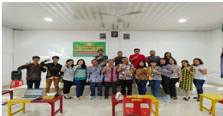
Gambar 3. Foto Bersama Warga Kelurahan Mangga dan perwakilan kelurahan Mangga

Setelah sesi diskusi dan tanya jawab selesai, tim PkM, Mahasiswa, perwakilan dari Kelurahan Mangga beserta warga mengadakan sesi foto sebagai bukti dokumentasi.