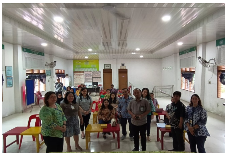
Gambar 2. Pemberian Games dan Sesi Tanya Jawab dengan Peserta

Setelah memberikan materi, tim PkM mengadakan sesi diskusi dan tanya jawab dengan peserta. Sebelum sesi tanya jawab dilakukan, tim PkM mengadakan games agar peserta tidak merasa bosan dan tetap antusias selama proses PkM berlangsung.