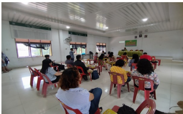
Gambar 1. Pemberian Materi oleh tim PkM

Para peserta memberikan perhatian penuh kepada pembicara selama sesi presentasi materi yang berkaitan dengan kegiatan lokakarya komunikasi damai. Materi yang diberikan ada 2 yaitu materi tentang politik uang dan golput. Hal ini dapat dilihat melalui gambar 1.