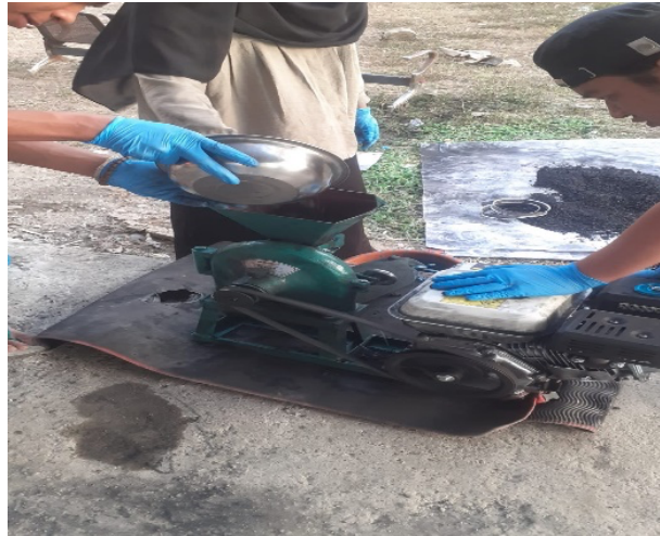
Gambar 3. Proses penggilingan

Gambar 3 merupakan tahapan ke-3 dalam proses pembuatan arang beriket, tahapan ini bertujuan menggiling arang bongol jagung pasca pembakaran.