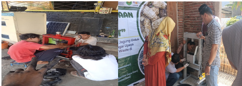
Gambar 4. Proses Pencetakan

Gambar 3 merupakan tahapan ke-3 dalam proses pembuatan arang beriket, tahapan ini bertujuan menggiling arang bongol jagung pasca pembakaran.