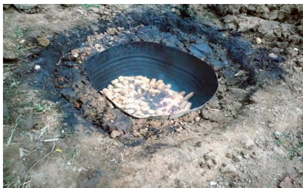
Gambar 2. Proses pembakaran Bongkol Jagung

Gambar 1 menunjukkan bahwa banyaknya limbah bonggol jagung yang sangat melimpah di kabupaten Sumbawa, tetapi selama ini belum dimanfaatkan secara maksimal oleh masyarakat sekitar.