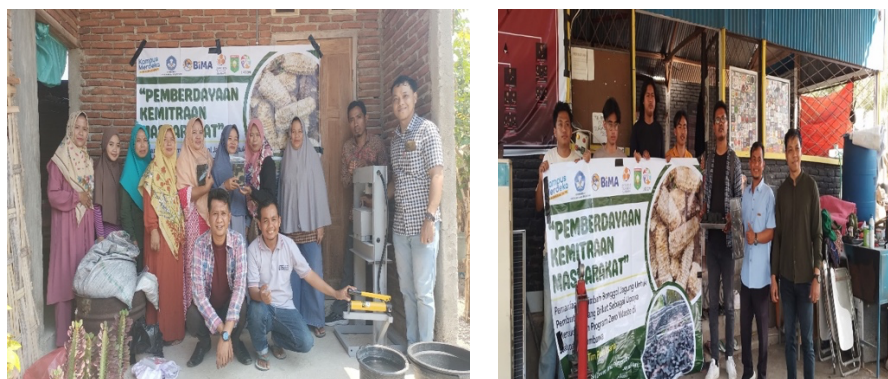
Gambar 8. Kegiatan Pelatihan pembuatan arang Briket

Paska sosialisasi kegiatan berikutnya TIM pelaksana pengabdian masyarakat memberikan praktik/pelatihan pembuatan arang briket, kegiatan ini melatih peserta supaya trampil dalam pembuatan arang briket.