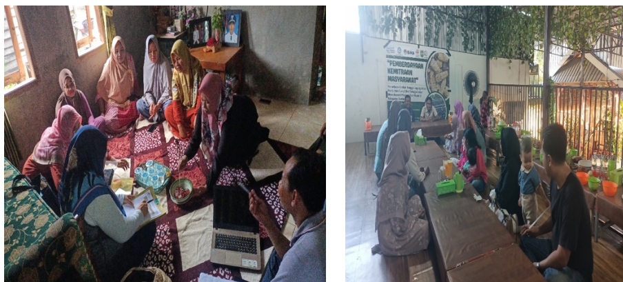
Gambar 7. kegiatan sosialisasi program

Gambar 6 ialah proses akhir yakni pengemasan sekaligus penjualan. Sebelum kegiatan pembuatan bonggol jagung dimulai terlebih dahulu TIM Pelaksana memberikan sosialisasi akan pentingnya pengelolaan bonggol jagung menjadi arang briket yang dapat menambah nilai ekonomi bagi Lembaga mitra.