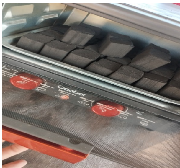
Gambar 5. Proses Pengeringan

Gambar 4 adalah proses pencetakan beriket menggunakan alat khusus supaya beriket menjadi keras dan tahan lama