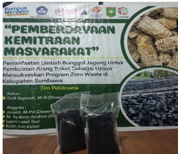
Gambar 6. Proses Pengemasan dan penjualan

Gambar 6 ialah proses akhir yakni pengemasan sekaligus penjualan. Sebelum kegiatan pembuatan bonggol jagung dimulai terlebih dahulu TIM Pelaksana memberikan sosialisasi akan pentingnya pengelolaan bonggol jagung menjadi arang briket yang dapat menambah nilai ekonomi bagi Lembaga mitra.