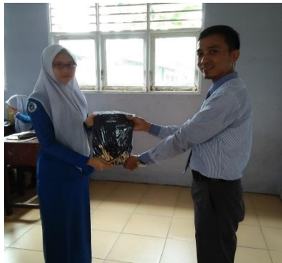
Gambar 7. Pemberian hadiah kepada siswa-siswi yang berhasil menjawab

Pelaksanaan kegiatan pelatihan penyusunan kas kecil ( petty cash ) dilaksanakan selama 2 hari dengan jumlah 30 siswa-siswi dengan durasi selama 2 jam mulai pukul 10.00 WIB s/d 12.00 WIB. Pengabdian kepada masyarakat diharapkan untuk mengukur kepaahaman siswa-siswi, maka tim memberikan beberapa pertanyaan sebelum ( pre-test ) dan pertanyaan sesudah ( post-test ) pada pengabdian ini dengan tujuan untuk melihat dan menilai kemampuan para siswa-siswi sebelum dan sesudah mengikuti pelatihan. Metode yang digunakan dalam pelaksanaan kegiatan pengabdian kepada masyarakat ini adalah metode pembelajaran pada umumnya yaitu dengan metode penjelasan materi, pelatihan secara langsung serta simulasi atau praktek. Tim pengabdian juga tidak lupa dalam memberikan saran, masukan, humor dan hadiah kepada siswa-siswi yang berhasil menjawab pertanyaan.