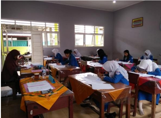
Gambar 5. Pelaksanaan diskusi hasil latihan teori penyusunan kas kecil

mulai dari pembentukan dana kas kecil, pemakaian dana kas kecil dan pengisian kembali dana kas kecil baik menggunakan metode imprest dan fluktuasi .