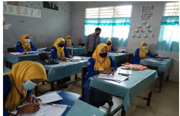
Gambar 2. Pemberian materi kas kecil secara teori