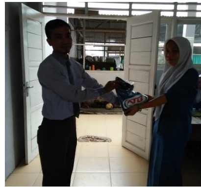
Gambar 8. Pemberian hadiah kepada siswa-siswi yang berhasil menjawab