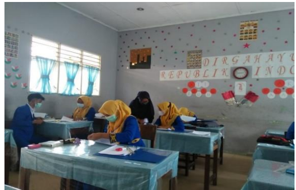
Gambar 4. Latihan penyusunan kas kecil