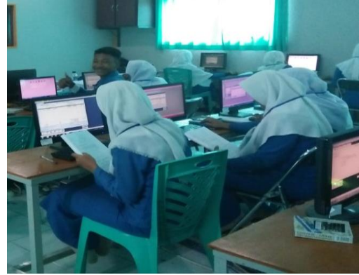
Gambar 6. Pelaksanaan diskusi hasil latihan praktik penyusunan kas kecil

Pelaksanaan kegiatan pelatihan penyusunan kas kecil ( petty cash ) dilaksanakan selama 2 hari dengan jumlah 30 siswa-siswi dengan durasi selama 2 jam mulai pukul 10.00 WIB s/d 12.00 WIB. Pengabdian kepada masyarakat diharapkan untuk mengukur kepaahaman siswa-siswi, maka tim memberikan beberapa pertanyaan sebelum ( pre-test ) dan pertanyaan sesudah ( post-test ) pada pengabdian ini dengan tujuan untuk melihat dan menilai kemampuan para siswa-siswi sebelum dan sesudah mengikuti pelatihan. Metode yang digunakan dalam pelaksanaan kegiatan pengabdian kepada masyarakat ini adalah metode pembelajaran pada umumnya yaitu dengan metode penjelasan materi, pelatihan secara langsung serta simulasi atau praktek. Tim pengabdian juga tidak lupa dalam memberikan saran, masukan, humor dan hadiah kepada siswa-siswi yang berhasil menjawab pertanyaan.