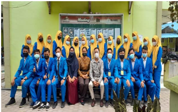
Gambar 1. Foto bersama guru dan siswa-siswi SMK Satrya Budi 2 Perdagangan Kabupaten Simalungun

Ceramah dan diskusi dilakukan sebelum kegiatan dimulai, sehingga ada koordinasi antara tim pengabdian dengan para guru, kemudian tim pengabdian akan melakukan penyuluhan tentang pelatihan penyusunan kas kecil secara teori dan praktik.