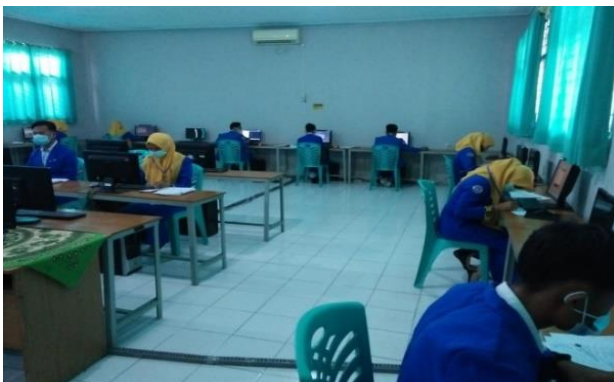
Gambar 3. Pemberian materi kas kecil secara praktik