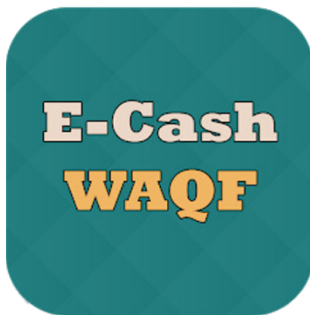
Gambar 2. Logo Aplikasi E-Cash Waqf