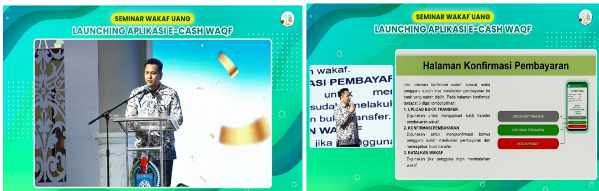
Gambar 3. Dokumentasi Pelaksanaan Kegiatan

Berikut dokumentasi dari kegiatan pengabdian masyarakat yang dilakukan :