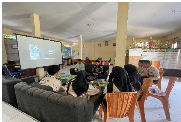
Gambar 2. Kegiatan Pembekalan Materi Pemasaran Digital

Tampilan dari akun media sosial yang digunakan untuk memasarkan objek wisata Goa Lawah tersaji pada Gambar 3, 4 dan 5 berikut.