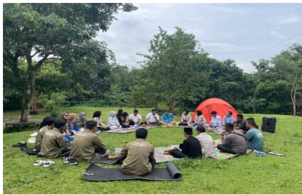
Gambar 1. Focus Group Discussion