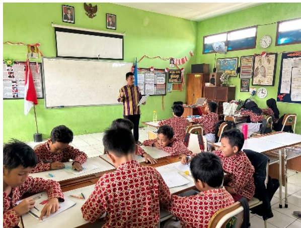
Gambar 5. Implementasi Modul Ajar dengan Pendekatan TaRL menggunakan Model PBL

proses pembelajaran disesuaikan dengan keinginan mereka. Kegiatan implementasi dilaksanakan 2 hari, modul ajar yang diimplementasikan menggunakan model PBL dengan 5 sintaks. Pada pertemuan pertama melaksanakan sintaks PBL 1- 3 yaitu orientasi masalah, mengorganisasikan peserta didik dan melakukan penyelidikan atau penelusuran untuk menjawab permasalahan. Kegiatan hari pertama dimulai dengan salam, doa dan presensi. Selanjutnya peserta didik diberikan LKPD yang didalamnya terdapat permasalahan yang harus diselesaikan peserta didik secara berkelompok.