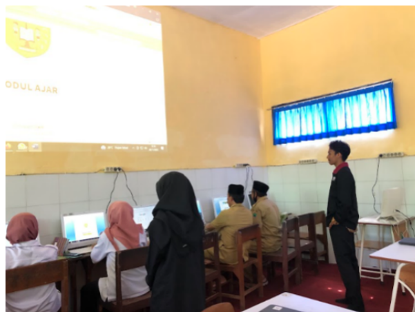
Gambar 3. Kegiatan Pendampingan secara luring

Kegiatan pendampingan dilaksanakan selama 2 bulan, dimulai bulan September-Oktober 2023. Pelaksanaan kegiatan pendampingan secara daring dan luring, kegiatan daring melalui Whatsapp Group dan Google Meet . Pada kegiatan ini terdapat target yang harus dicapai oleh guru pada setiap minggunya, target ini memiliki tujuan agar modul ajar yang dihasilkan sesuai dengan kondisi kebutuhan peserta didik. Dengan adanya kegiatan pendampingan ini dapat digunakan guru sebagai latihan secara langsung untuk dapat menyusun modul ajar yang berkualitas (Maryono et al., 2023). Tim pendampingan mengecek setiap hasil penyusunan modul ajar yang telah dibuat. Selain itu juga memastikan bahwa modul ajar yang dibuat sudah sesuai dengan karakteristik dan kebutuhan peserta didik yang ada di kelas. Kegiatan pendampingan dibantu dengan mahasiswa yang berkolaborasi melakukan kegiatan PMM mitra dosen sehingga kegiatan pendampingan dapat dilaksanakan secara maksimal.