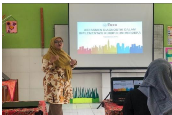
Gambar 2. Kegiatan Workshop

Kegiatan pertama yang dilakukan yaitu workshop penyusunan modul ajar dengan pendekatan TaRL. Pelaksanaan kegiatan workshop pada hari Jumat, 15 September 2023 bertempat di Ruang kelas II SDN Oro-oro Dowo Malang beralamat Jl. Brigadir Jenderal Slamet Riyadi Gang 8 Oro-oro Dowo Kec. Klojen Kota Malang. Kegiatan ini dihadiri oleh guru berjumlah 9 orang dengan rincian 6 guru kelas, 2 guru mata pelajaran dan 1 kepala sekolah. Kegiatan workshop dilaksanakan selama 3 jam di mulai pukul 09.00 dan berakhir pada pukul 12.00. Adapun materi yang disampaikan adalah penyusunan modul ajar dengan pendekatan TaRL. Kegiatan ini sangat penting dilakukan karena guru belum pernah mengikuti pelatihan terkait ini. Guru perlu diberikan materi dan contoh agar memperoleh gambaran untuk dapat menerapkan pendekatan TaRL di dalam pembelajarannya di kelas.