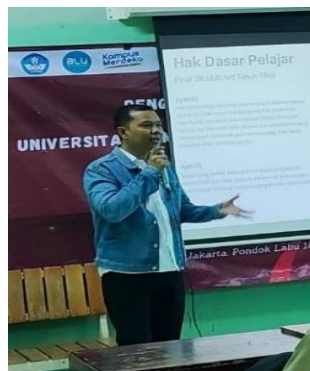
Gambar 3. Penyampaian Materi oleh Pemateri 2

Dengan ini, peserta dapat menumbuhkan kesadaran akan hak konstitusional generasi muda terutama pelajar agar selalu menghormati hak konstitusional orang lain dan dirinya sendiri. Kegiatan dilanjutkan dengan tanya jawab antara peserta dan pemateri mengenai materi yang telah disampaikan.