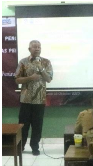
Gambar 2. Penyampaian Materi oleh Pemateri 1

Pemateri 1 menekankan bahwa kelima konsep tersebut merupakan hal-hal yang harus ditanamkan dalam diri pelajar. Penjewantahan dari hak konstitusional lebih dekat pada poin 2, yakni kesadaran berbangsa dan bernegara. Pemateri 1 menjelaskan bahwa hak konstitusional sangat erat kaitannya dalam penyelenggaraan berbangsa dan juga menjalankan roda bernegara karena konsep menjalankan sebuah negara harus berdiri pada prinsip konstitusionalisme atau berlandaskan pada rambu-rambu dan aturan yang menjadi kontrak sosial rakyat Indonesia yang berupa konstitusi. Dengan demikian, penyelenggaraan negara dalam menjalankan negara juga tidak sewenang-wenang. Selain itu, kesadaran berbangsa juga erat kaitannya dengan keberlangsungan hak-hak yang ada yang harus dihormati, baik secara individu maupun kelompok. Pemateri 1 juga menekankan bahwa kesadaran berbangsa dan bernegara tidak hanya diketahui, namun juga harus dikonkritkan dengan menjalankan hal-hal yang diatur dalam konstitusi.