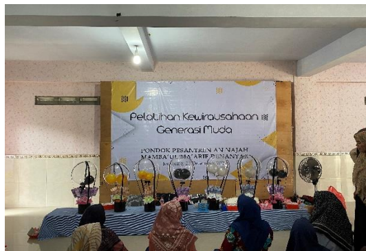
Gambar 4. Hasil Pembuatan Buket Balon

Dalam praktek pembuatan buket balon para santri sangat antusias dan sangat senang sekali. Hal ini dapat dilihat dari hasil karya santri yang bagus dan menarik walaupun para santri baru pertama kali mencoba untuk membuat.