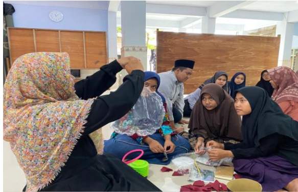
Gambar 3. Praktek Pembuatan Buket Balon

(Advertising), Kehumasan (Public Relation), Promosi Penjualan (Sales Promotion), Penjualan Perseorang (Personal Selling). Untuk kebijakan Kehumasan (Public Relation) dapat ditempuh antara lain dengan menyediakan brosur, memberikan penjelasan atau keterangan dan mengambil peran sebagai sponsor. Untuk kebijakan Promosi Penjualan (Sales Promotion) dapat dilaksanakan dengan fee atau menghilangkan biaya-biaya tertentu. (Januarwati & Poernomo,2014:158).