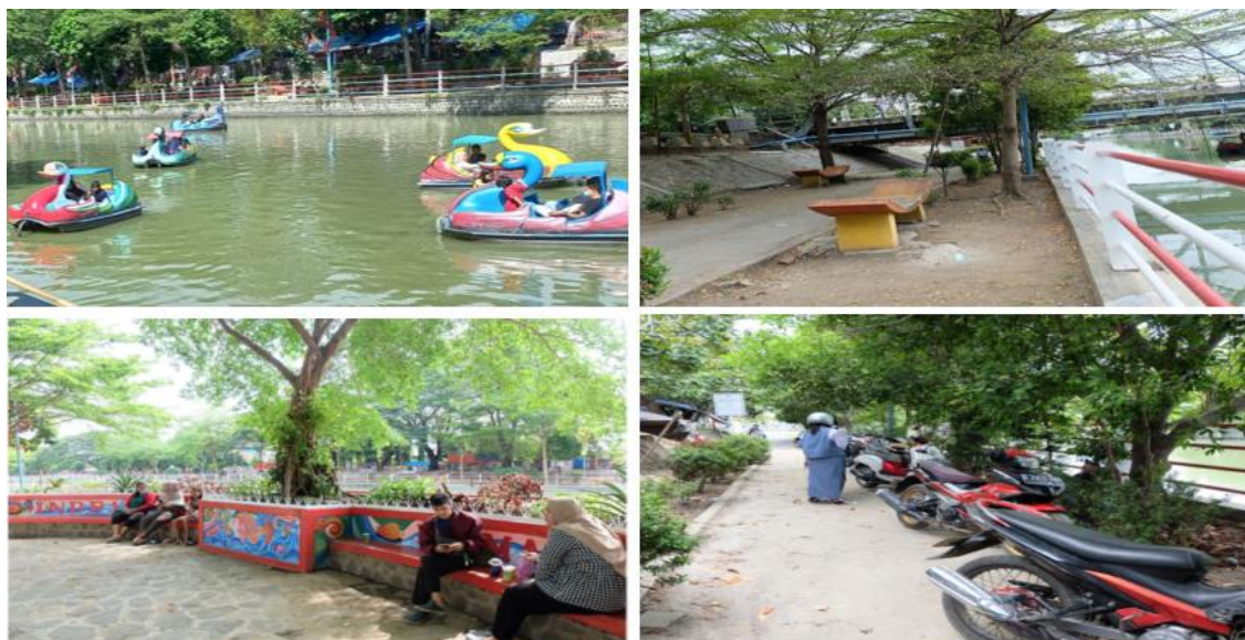
Gambar 4. Fasilitas Taman Tjimanoeok sebagai daya tarik eduwisata

Setelah dilakukan pembahasan dan diskusi tentang perlunya partisipasi masyarakat dalam menjaga keberlanjutan Taman Tjimanoeok, serta penting Pokdarwis, dari 39 peserta diskusi yang hadir mewakili kelompok pemuda, guru SMPN4, komunitas pedagang sekitar Tjimanoeok 38 peserta (97.44 %) setuju untuk membentuk Pokdarwis dengan nama “Pokdarwis Tjimanoeok” dan hanya 1 peserta (2.56 %) kurang setuju karena menganggap peran pemerintah belum maksimal. Dasar Hukum pembentukan Pokdarwis Tjimanoeok adalah: 1) Peraturan Menteri Kebudayaan dan Pariwisata No PM.04/UM.001/MKP08 tentang sadar wisata, dan 2) Peraturan Menteri Kebudayaan dan Pariwisata No. 11 PM 17/PR.001 /MKP/ tentang Rencana Strategis Kementerian Kebudayaan dan Pariwisata tahun 2010-2014.