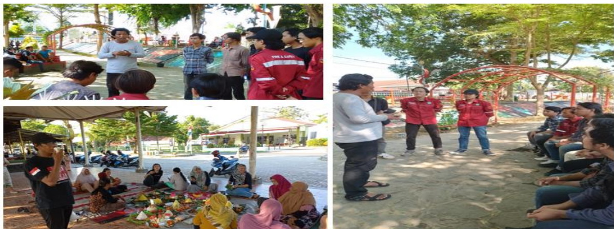
Gambar 5. Team Pokdarwis pengawas dan pendamping wisatawan di Taman Timanoek

Untuk mendukung keberlanjutan Taman Tjimanoeok, Pokdarwis dengan sukarela membentuk team terdiri 3-4 orang yang diberi tugas memberikan penyuluhan dan edukasi kepada para pengunjung khususnya pada setiap akhir pekan secara bergantian, dan siap mendampingi pengunjung agar tetap bijak di area taman. Mereka terdiri dari para anggota pokdarwis dari kalangan pemuda, dan kelompok ini juga memanfaatkan Taman Tjimanoeok sebagai tempat membangun kreativitas kalangan muda. Team Pokdarwis yang melakukan tugas memberikan edukasi kepada pengunjung seperti gambar 5.