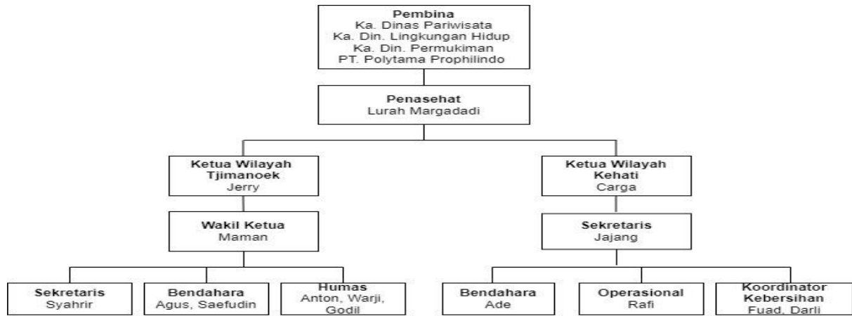
Gambar 5. Struktur Organisasi Pokdarwis Tjimanoeok

Pokdarwis Tjimanoeok mempunyai tugas untuk menciptakan lingkungan dan suasana kondusif yang mampu mendorong tumbuh dan berkembangnya Taman Tjimanoeok dan Taman Kehati sebagai pusat pariwisata keluarga da edu-tourism melalui perwujudan unsur aman, tertib, bersih, sejuk, indah, ramah dan unsur kenangan. Pokdarwis Tjimanoeok telah dapat menjadi mitra bagi Pemerintah Daerah, dalam upaya mewujudkan pengembangan Sadar Wisata bagi masyarakat di wilayah Kabupaten Indramayu.