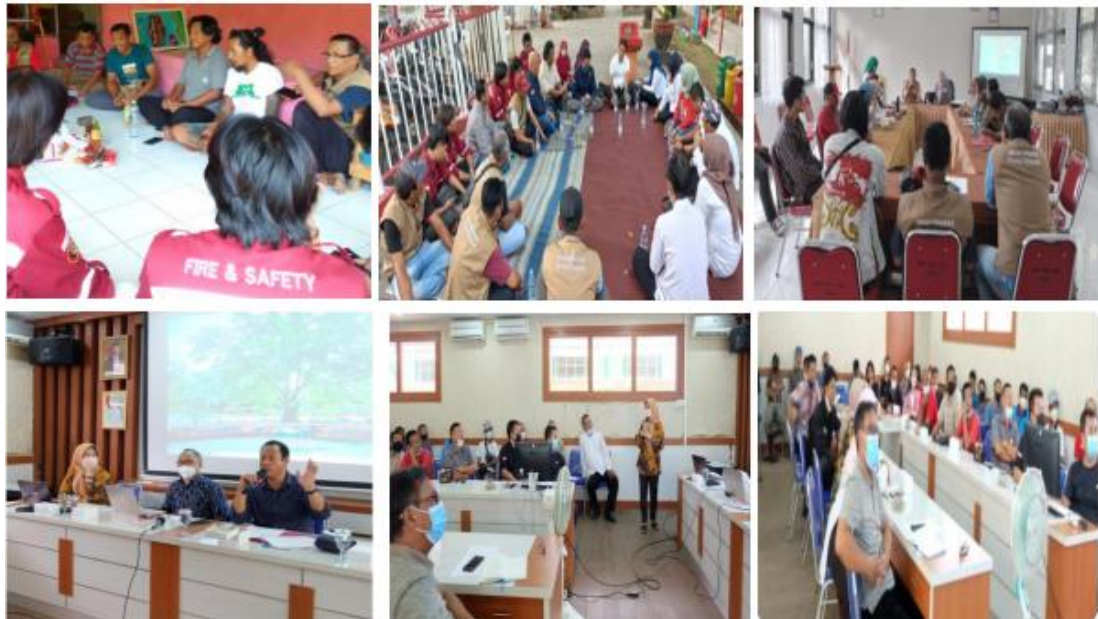
Gambar 2. Diskusi Pembentukan Pokdarwis Taman Tjimanoeck

satu pendekatan dalam penyelesaian masalah dan mencari solusi dengan cara mengembangkan ide dan tanya jawab yang melibatkan banyak pihak. Peserta diskusi adalah pedagang kuliner dan pengamen kali Tjimanoeck, Lurah Margadadi, perwakilan PT Polytama Propilindo, mahasiswa, guru2 dari SMPN 4 Indramayu, dan tokoh masyarakat di sekitar kawasan kali Tjimanoeck, seperti pada Gambar 2.