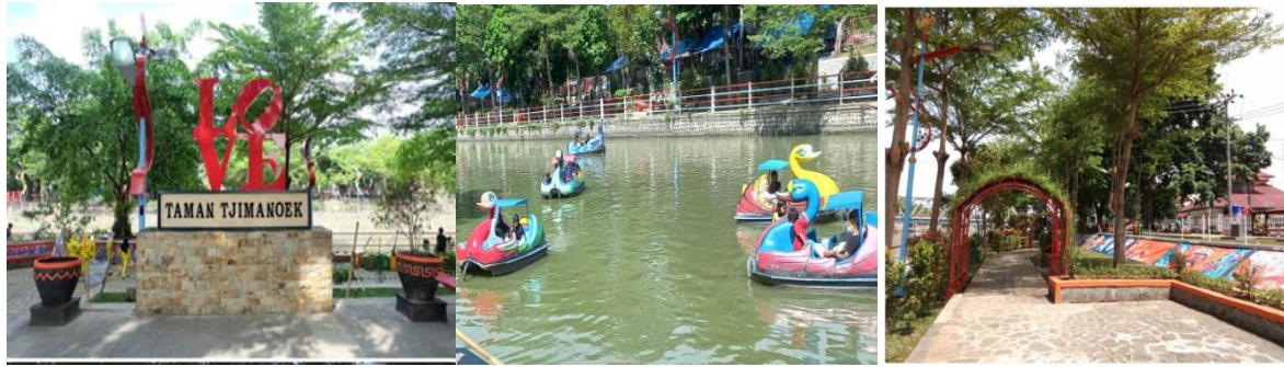
Gambar 1. Beberapa area wisata Taman Tjimanoeik

Taman Tjimanoeik Indramayu sebenarnya telah dibangun oleh Pemerintah Daerah Kabupaten Indramayu sejak tahun 2014, dan pada tahun 2021 dilakukan renovasi dan penambahan fasilitas berupa arena bermain anak, penanaman bunga-bunga, dan area foto tiga dimensi berlatar lukisan mural dan sejarah kota Indramayu maupun kali Tjimanoeik sendiri yang pernah menjadi pelabuhan terbesar kedua setelah Sunda Kelapa pada masa penjajahan Belanda. Taman Tjimanoeik memiliki potensi sebagai pusat wisata keluarga dan eduwisata untuk masyarakat Indramayu dan sekitarnya, (Kholil et al. 2021).