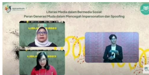
Gambar 2. Tangkapan Layar Penyampaian Materi pada Kegiatan Pengabdian melalui Aplikasi Zoom