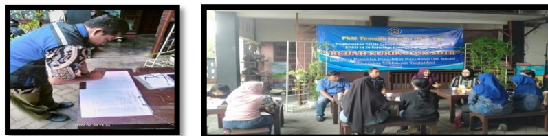
Gambar 4. Foto Kegiatan Bedah Kurikulum

Bertepatan dengan hari Jum'at tanggal 23 Juni 2023 bertempat di Pos PAUD Permata Bunda, dilakukan Bedah Kurikulum SOTH. Berikut ini adalah foto dokumentasi dari kegiatan Bedah Kurikulum yang dilaksanakan untuk persiapan pembentukan SOTH :