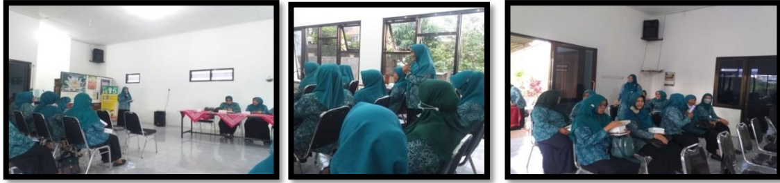
Gambar 2. Rapat bersama PKK Kelurahan untuk Pembentukan Sekolah Orang Tua Hebat

Setelah melakukan penyamaan persepsi terhadap seluruh stakeholders terkait. Langkah selanjutnya adalah duduk bersama dalam rapat pada Jum'at, 9 Juni 2023 di Balai RW.02. Berikut ini adalah foto dokumentasi suasana rapat tim pengabdian masyarakat dari UNITRI dengan tersebut :