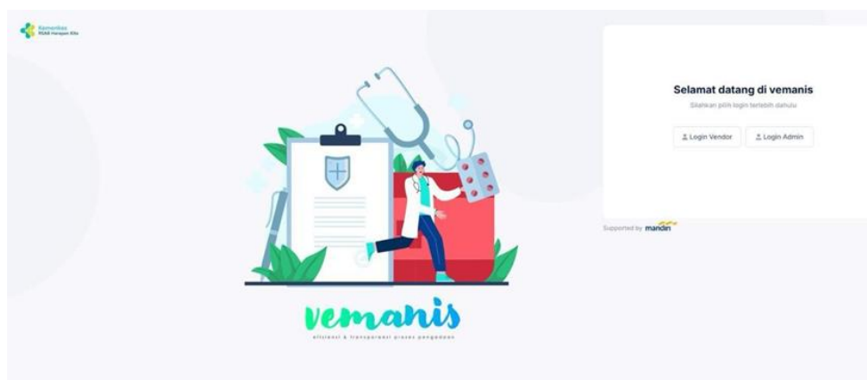
Gambar 2. Dashboard Web Aplikasi VEMANIS

Dashboard merupakan halaman utama yang ditampilkan setelah pengguna berhasil masuk ke dalam sistem. Halaman ini berfungsi sebagai pusat informasi yang menampilkan berbagai data penting terkait proses pengadaan barang dan jasa secara ringkas dan terstruktur. Dashboard aplikasi VEMANIS menampilkan berbagai fitur utama seperti informasi status pengadaan, notifikasi sistem, serta menu navigasi untuk mengakses berbagai modul yang tersedia dalam sistem. Tampilan dashboard dirancang agar memudahkan pengguna dalam memantau aktivitas pengadaan serta mengakses informasi yang diperlukan secara cepat. Tampilan dashboard aplikasi VEMANIS dapat dilihat pada Gambar 2.