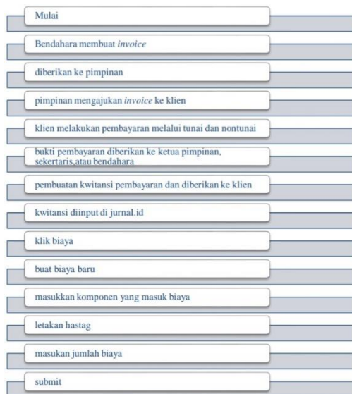
Gambar 1. Alur sistem informasi akuntansi penerimaan kas

Sistem Informasi Akuntansi Pengeluaran Kas Pada LARISPA Indonesia untuk pengeluaran kas perusahaan berasal dari dana kas kecil dan fungsi yang terkait dalam sistem pengeluaran kas yaitu bagian kasir, dan bagian kasir pada perusahaan bertugas menerima kas, dan mengeluarkan kas tunai dari simpanan kas kecil. Dalam proses pengeluaran kas, bagian kasir akan memberikan form pengajuan pengeluaran di tanda tangani oleh bagian kasir setelah itu form pengajuan diberika ke pimpinan untuk mengeluarkan dana kas kecil, dan untuk setiap pengeluaran yang terjadi perlu disertai dengan nota sebagai bukti pengeluaran, dan ini akan dicatat oleh bagian akuntansi dan diinput ke dalam sistem Jurnal.id. Untuk dokumen yang digunakan dalam pengeluaran kas pada perusahaan adalah form vocer pengeluaran kas, bukti pengeluaran kas, dan catatan akuntansi yang digunakan di jurnal.id dalam perusahaan .