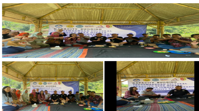
Gambar 3. FGD dan Capacity Building dalam Skema “Rembug Desa”