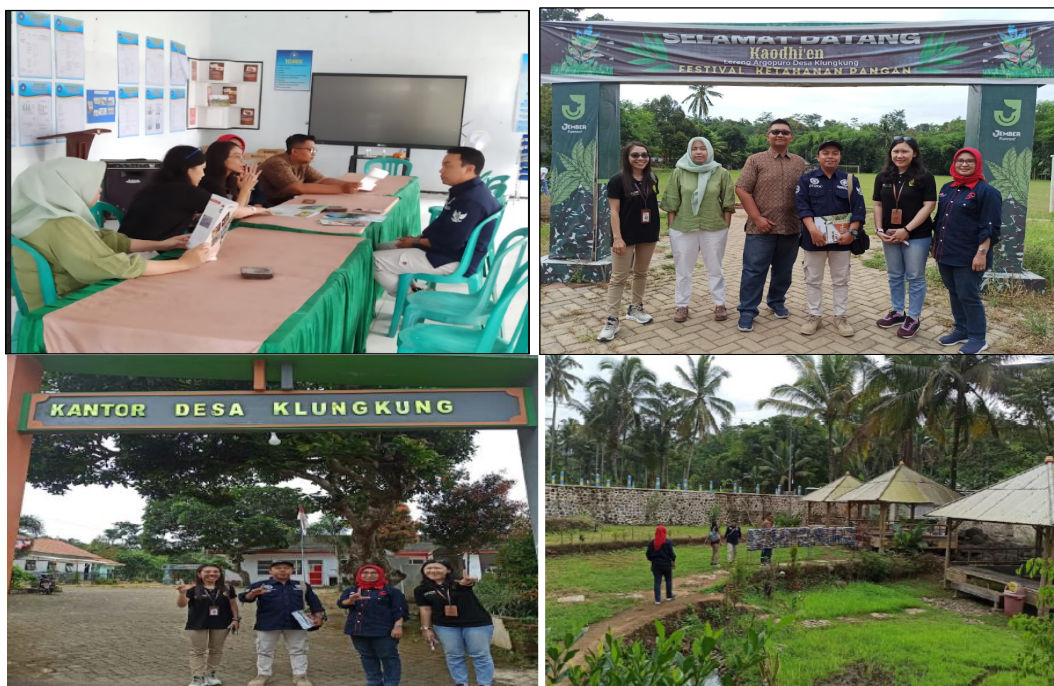
Gambar 2. Sosialisasi Rencana Program Kegiatan Pengabdian kepada Masyarakat.