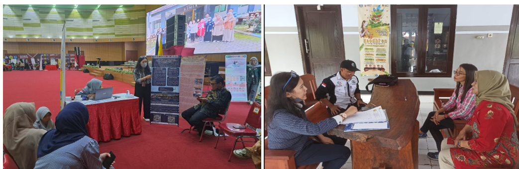
Gambar 5. Kegiatan Monev dan Kolokium Hibah Pengabdian Masyarakat Universitas Jember 2025