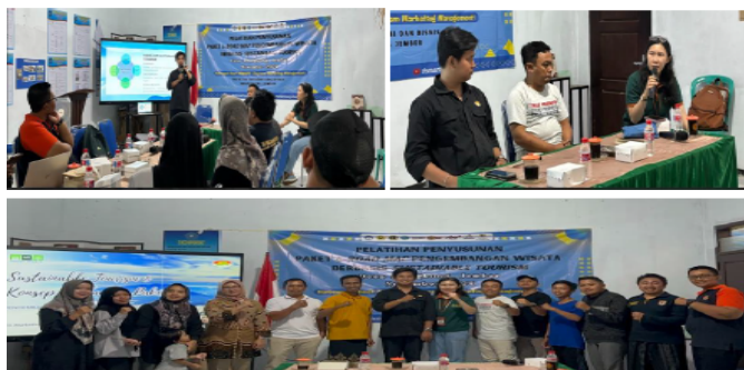
Gambar 4. Pelatihan Penyusunan Paket Wisata dan Road Map Pengembangan Wisata berbasis Pariwisata Berkelanjutan.

Seperti yang telah dikemukakan sebelumnya, Desa Klungkung memiliki beberapa event budaya. Pemberian pelatihan penyusunan paket dan road map wisata juga fokus pada manajemen event budaya yang rutin diadakan selama ini. Tim pengabdian memberikan pemahaman dan pengetahuan pada tim pelaksana event agar semua event budaya yang diadakan di Desa Klungkung dapat dilaksanakan dengan mempertimbangkan