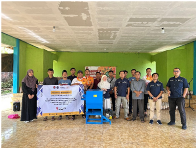
Gambar 5. Penyerahan Mesin Pencacah Rumput kepada Kelompok Ternak Bumdes Kridatama

Untuk memastikan keberlanjutan program, dibentuk tim internal pengelola mesin yang terdiri dari lima anggota terlatih dari kelompok ternak. Tim ini bertugas memantau penggunaan mesin secara berkala, melakukan perawatan rutin, serta mencatat aktivitas operasional harian dalam log book sebagai dokumentasi resmi. Selain itu, tim juga diberikan panduan tertulis lengkap mengenai prosedur perawatan mesin dan teknik pengolahan pakan fermentasi, sehingga mereka dapat menjalankan pengelolaan mesin secara mandiri dan berkelanjutan.