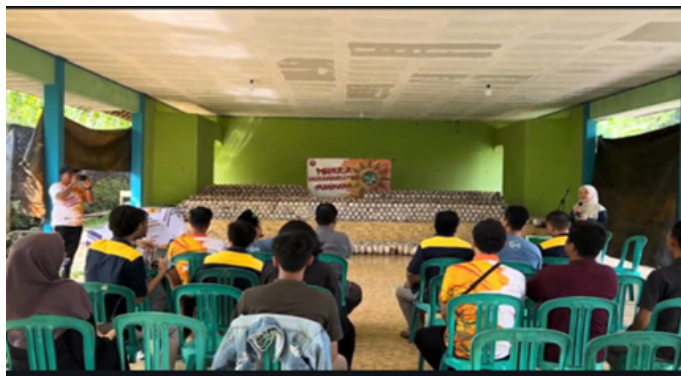
Gambar 2. Sosialisasi Program

Untuk mengukur pemahaman awal, dilakukan diskusi interaktif dan pre-test singkat berbasis kuis lisan (5 pertanyaan) yang menguji pengetahuan dasar tentang pakan ternak, manajemen pakan, dan teknologi pengolahan. Langkah awal sosialisasi program ditunjukkan oleh Gambar 2.