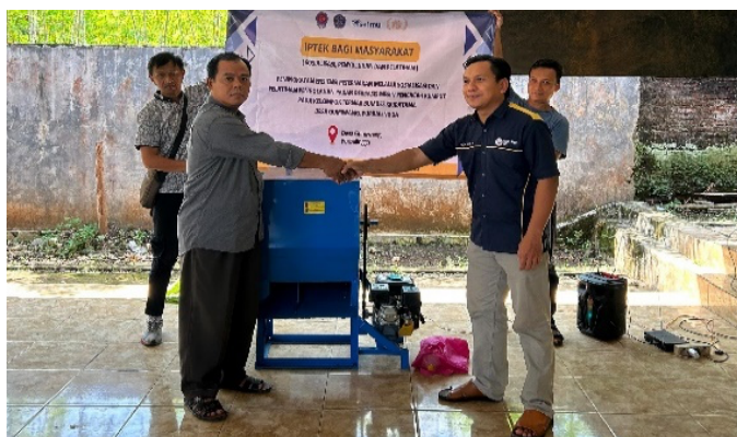
Gambar 3. Penyerahan alat secara simbolis kepada kelompok

Setelah sosialisasi, mesin pencacah rumput diproduksi bekerja sama dengan mitra teknis lokal. Mesin berbasis motor bensin 5,5 HP ini dirancang hemat biaya dan mampu mencacah rumput dengan kapasitas 80–100 kg per jam, jauh lebih efisien dibanding metode manual yang hanya mengolah sekitar 20–25 kg dalam waktu yang sama. Mesin diserahkan secara simbolis kepada kelompok pada bulan Mei 2025 dalam seremoni yang dihadiri oleh perwakilan desa, tokoh masyarakat, dan seluruh anggota kelompok Gambar 3. Acara ini menjadi momentum penting dalam membangun komitmen bersama dan dukungan kelembagaan terhadap adopsi teknologi baru.