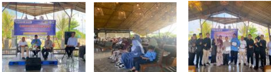
Gambar 2. Kiri ke kanan; Pemateri Memberikan Materi, Antusias Peserta dalam Diskusi, Foto Bersama

Selanjutnya dilanjutkan dengan tanya jawab peserta dan pemateri. Peserta terlihat sangat antusias dalam mengikuti seminar, hal ini dapat dilihat dari keterlibatan peserta dalam tanya jawab dan diskusi. Diakhir acara dibagikan angket untuk mengukur keterlaksanaan dan pencapaian tujuan dari kegiatan. Gambar pelaksanaan untuk kegiatan seminar dapat dilihat pada Gambar 2 di bawah ini: